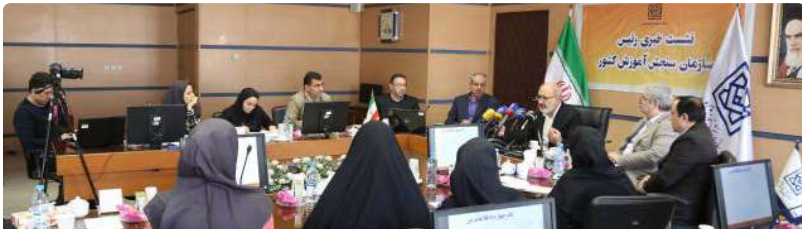
رئیس سازمان سنجش آموزش کشور تشریح کرد