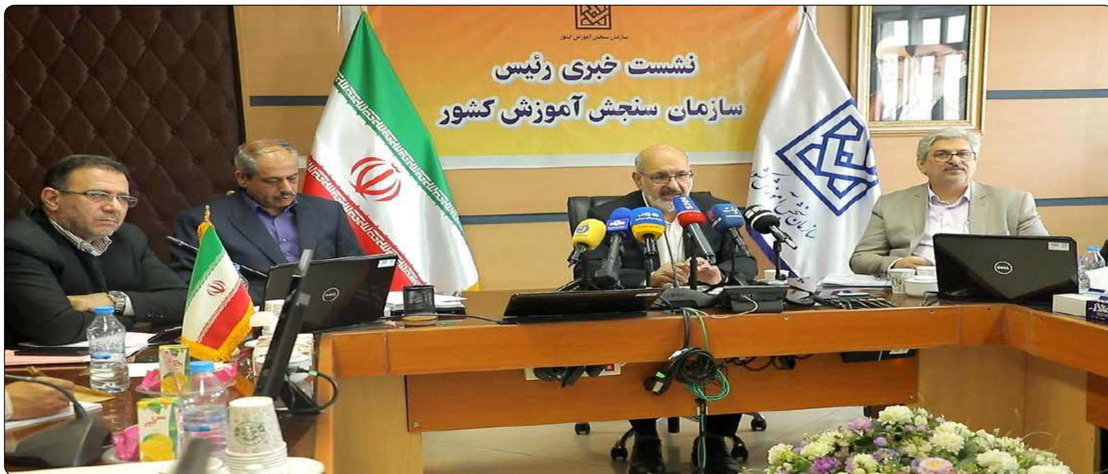
نشست خبری رئیس سازمان سنجش آموزش کشور